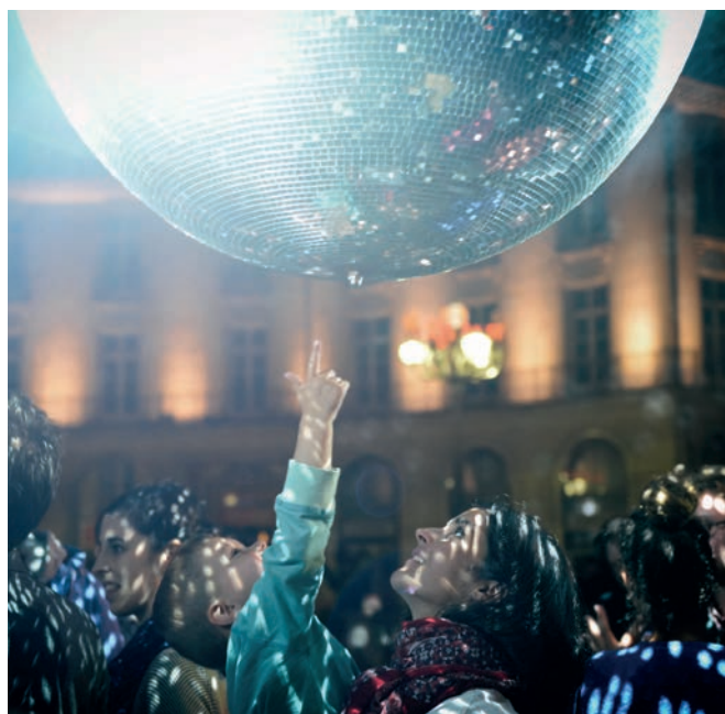
LA NUIT DU VAN 2016