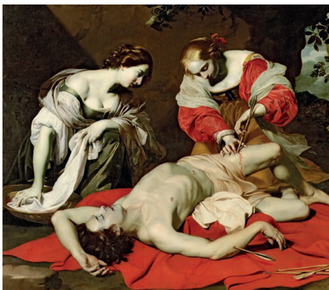
NICOLAS RÉGNIER «SAINT-SÉBASTIEN SOIGNÉ PAR SAINTE-IRÈNE ET UNE SERVANTE» FERENS ART GALLERY, HULL MUSEUM