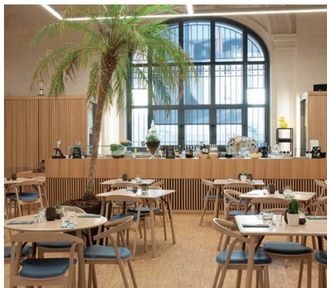
CAFÉ DU MUSÉE