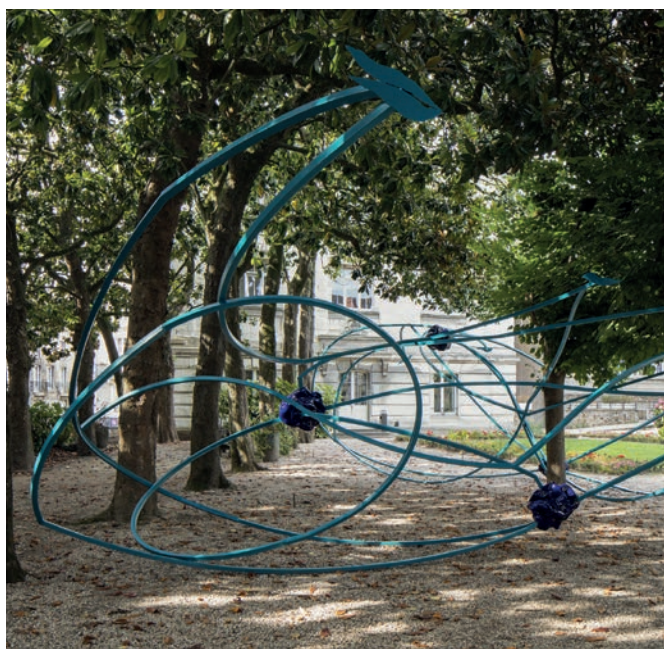
P.-A. RÉMY, COURS À TRAVERS - VOYAGE À NANTES 2017