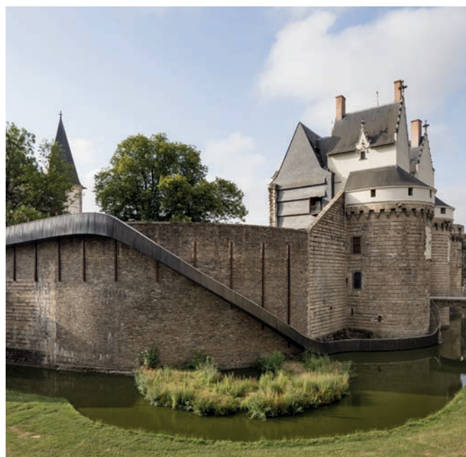
TACT ARCHITECTES, T. ROBERT, PAYSAGE GLISSÉ