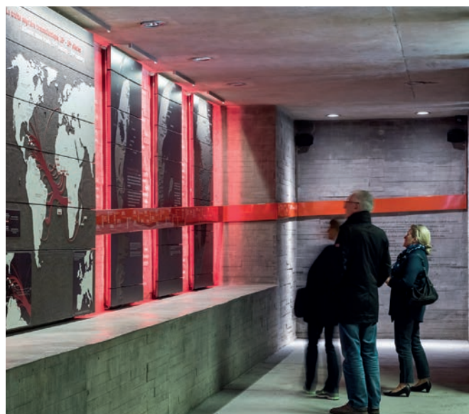
MÉMORIAL DE L'ABOLITION DE L'ESCLAVAGE. - NANTES