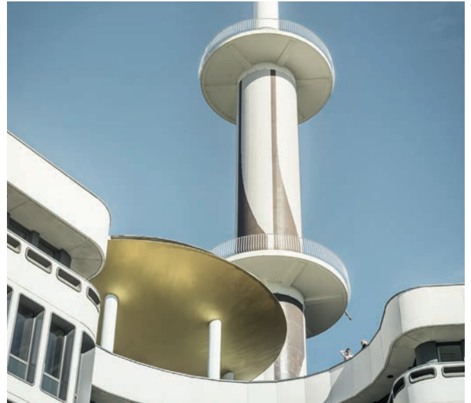
LE MABILAY, RENNES